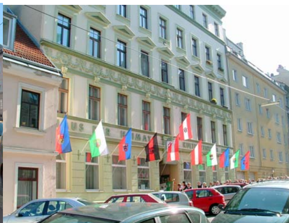
in das „Haus der Heimat“