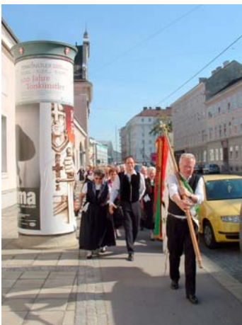
Der Schwabenverein auf dem Weg